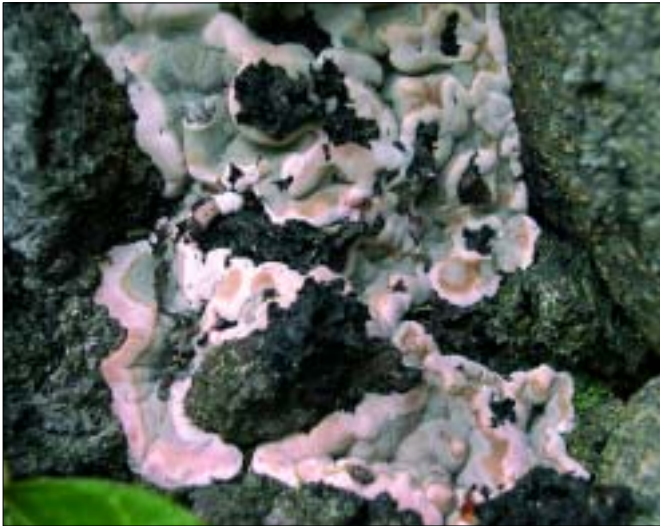
Abbildung 2: Frühstadium des Fruchtkörpers des Brandkrustenpilzes